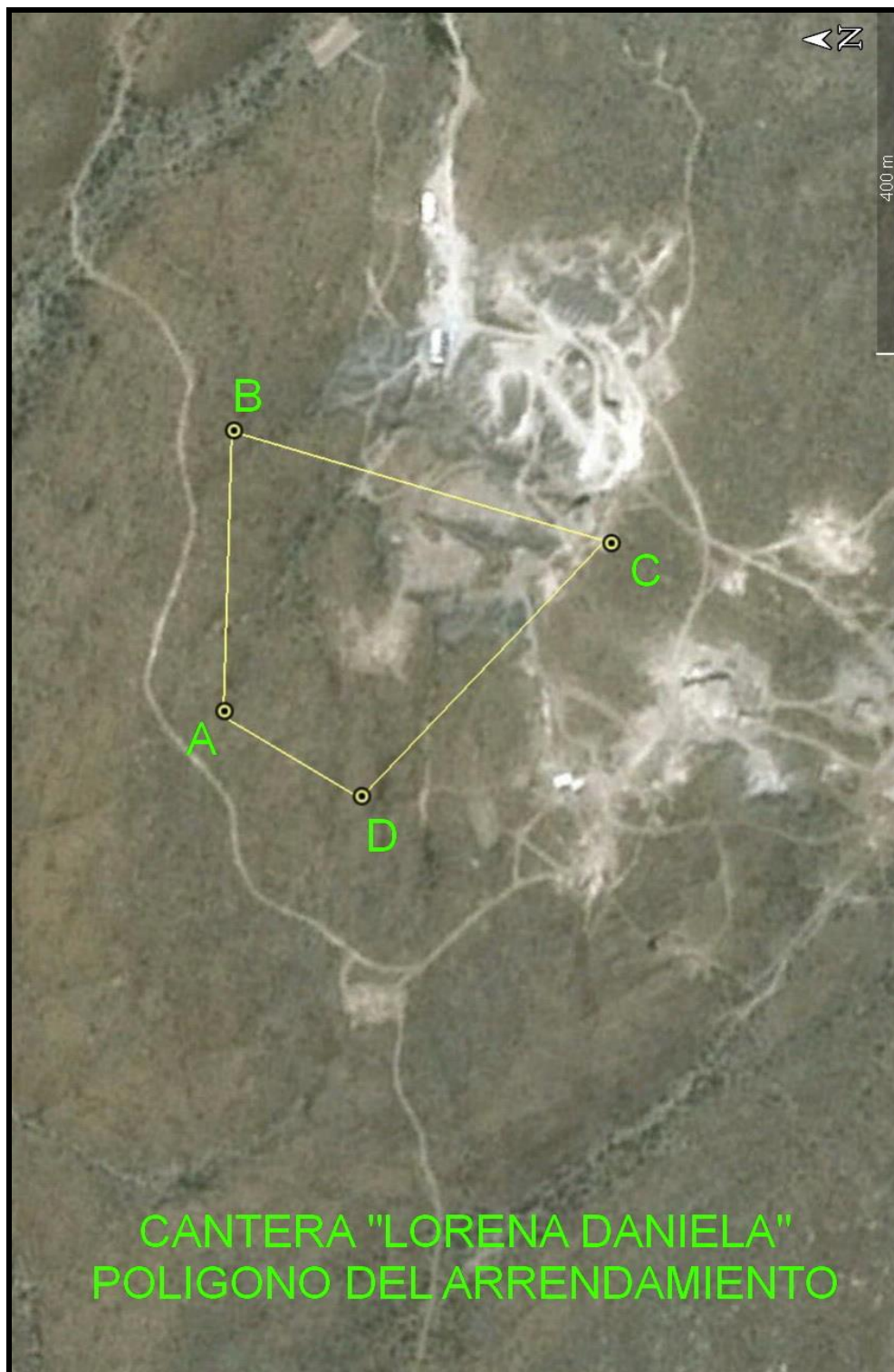
Figura Nº 1 – Ubicación del área de estudio