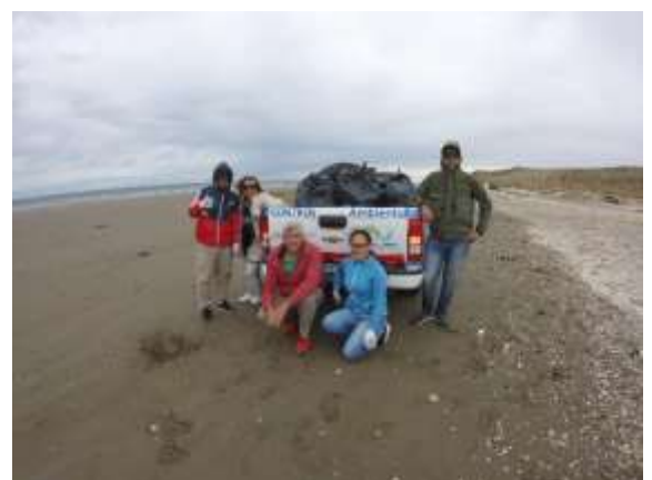
TRABAJO COSTERO TERMINADO