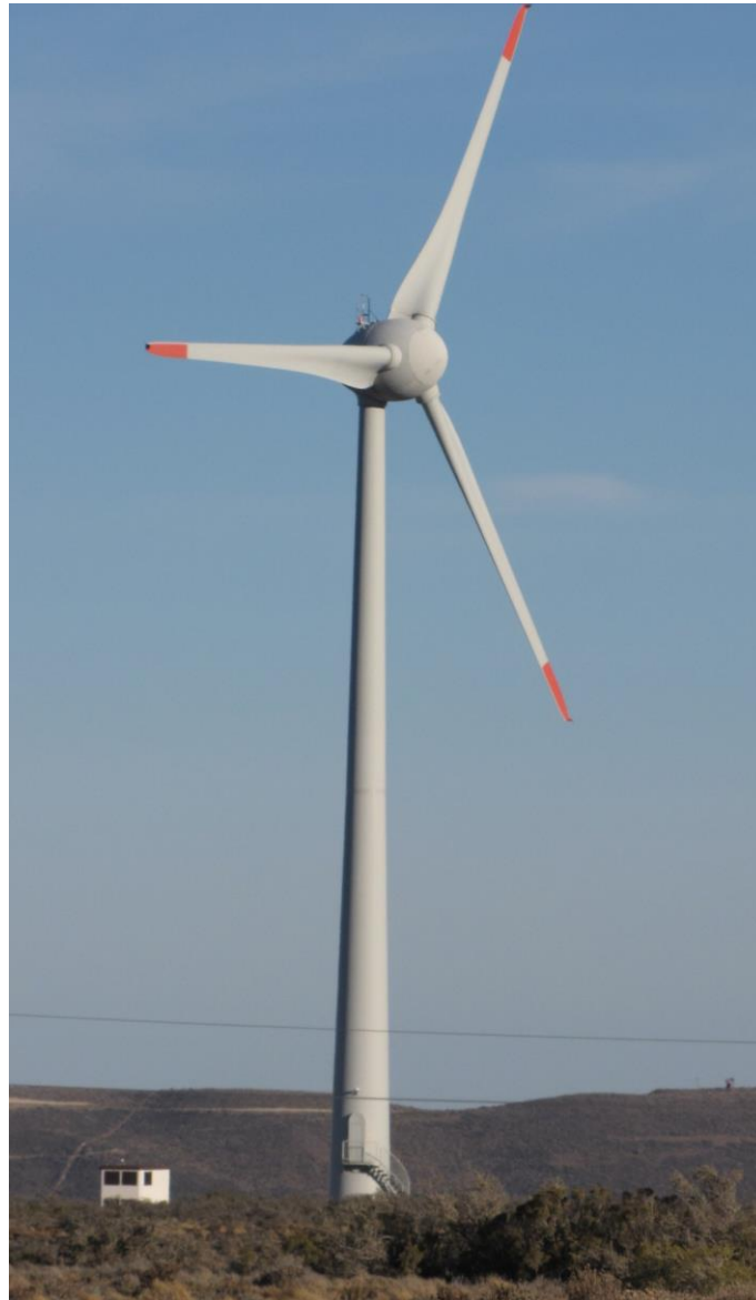
Aerogenerador en funcionamiento