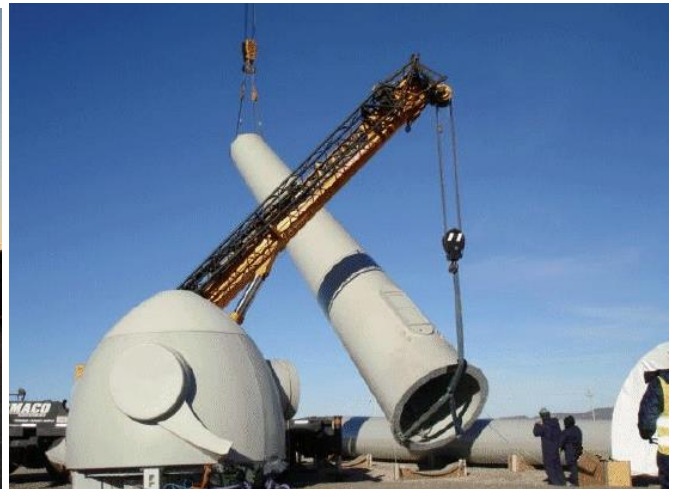
Montaje de Torres