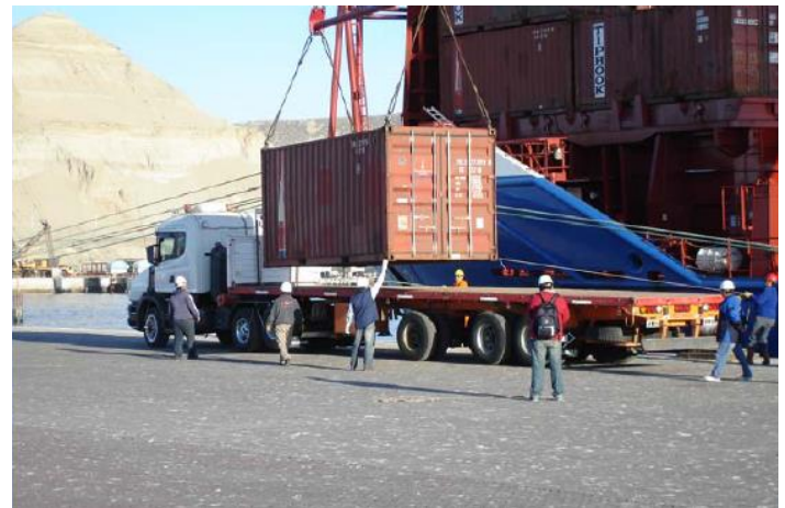
Desembarco en Comodoro Rivadavia