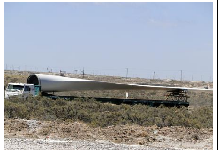
Transporte Comodoro Rivadavia – Diadema