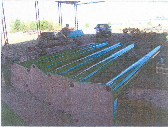
VISTA DE LAS COLUMNAS